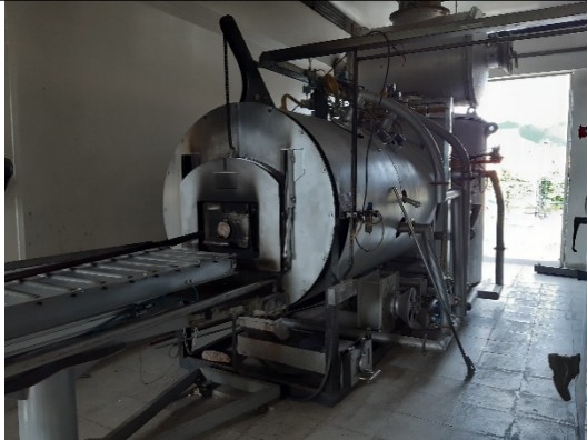
Foto No. 1 Horno No. 1