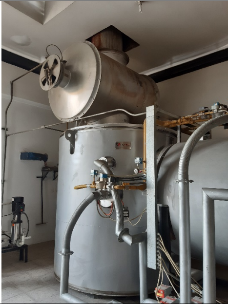
Foto No. 3 sistema de control