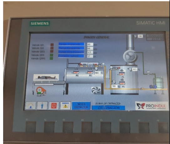
Foto No. 6 Diagrama de temperaturas del horno