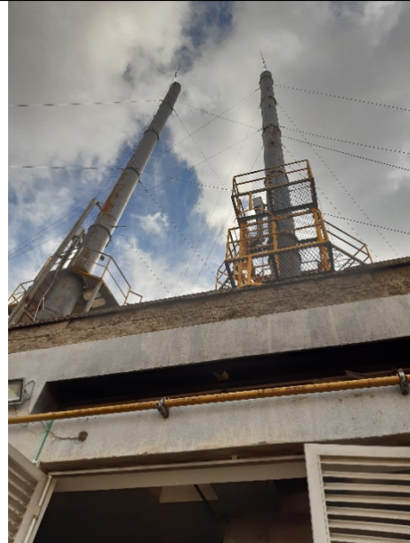
Foto No. 4 ductos de los hornos