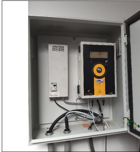
Foto No. 5 Sistema de monitoreo continuo