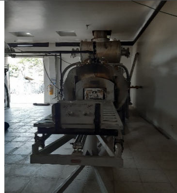
Foto No. 2 Horno No. 2